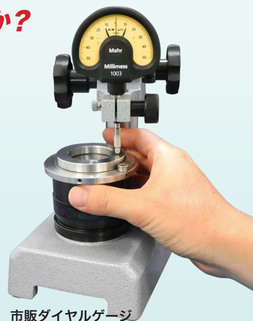
市販ダイヤルゲージ スタンドを用いた使用例