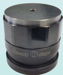
<スムーピー本体> 型式 SPS-58 (mm)