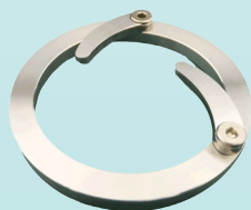
<芯出しガイド> 型式 CG-58A